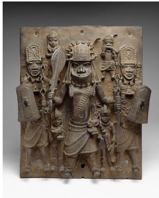
Plaque: Warrior and Attendants, 16 de -17 de eeuw, Edo-cultuur (Nigeria), te zien in Metropolitan New York. Zie artikel Evelien Campfens in NRC.

“Koloniale roofkunst krijgt nog altijd minder aandacht dan naziroofkunst”, stelt ons lid Evelien Campfens in het NRC. “Er is ook veel onduidelijk. Is de diamant van de sultan, het volk of de regering? „Het is de hoogste tijd die lastige vragen te beantwoorden.” Lees hier het opinie-artikel >>